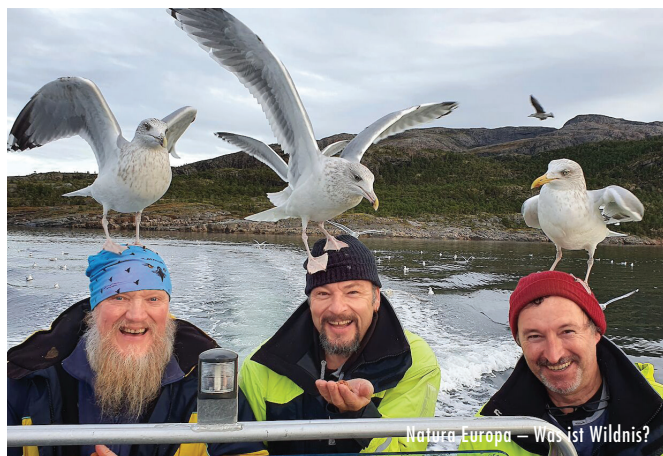
Natura Europa – Was ist Wildnis?