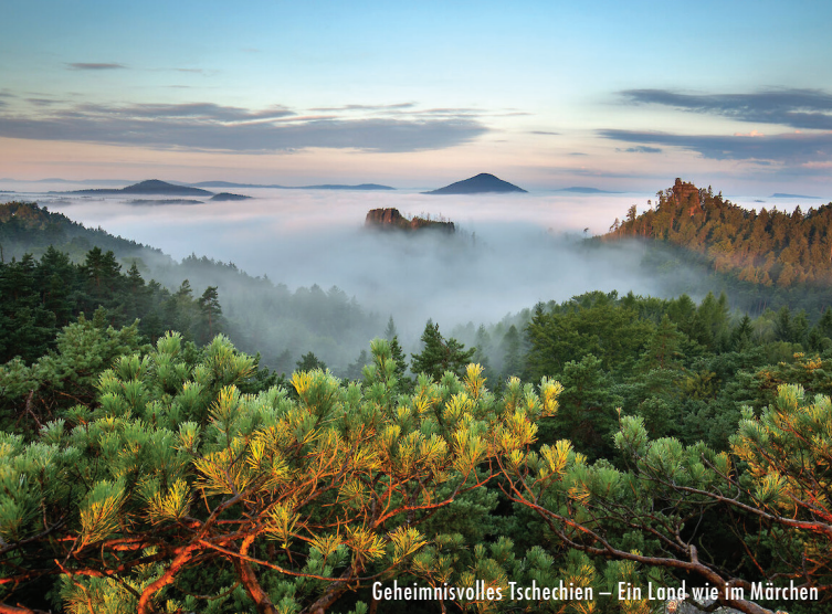
Geheimnisvolles Tschechien – Ein Land wie im Märchen