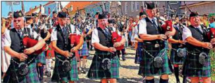
Gäste aus dem Norden: Die Schotten im Kilt und mit der Great Highland Bagpipe.