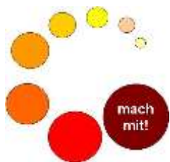
Schulprojekt „Mitmachen Ehrensache!“