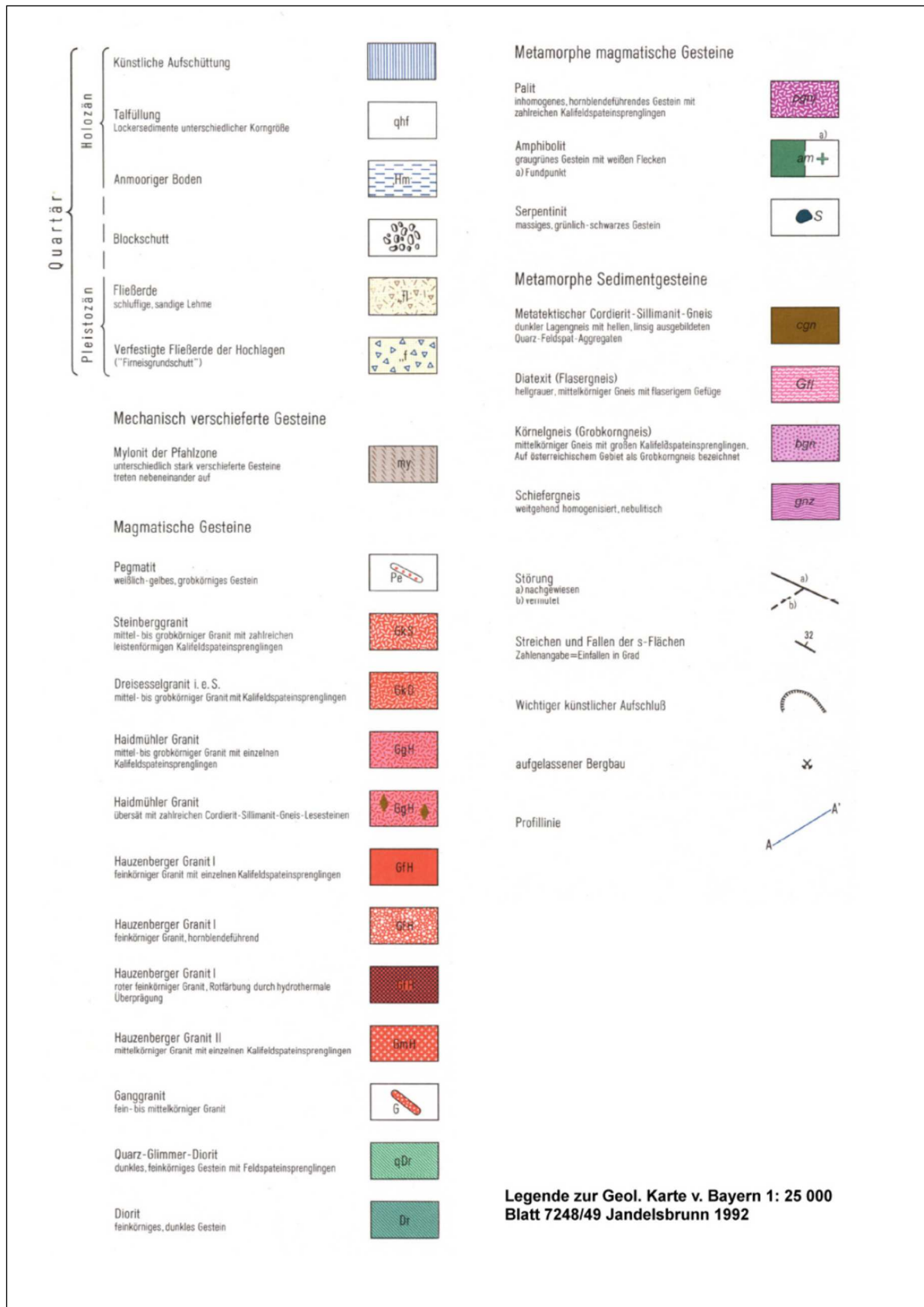
Abbildung 2b: Legende zur Geologischen Karte