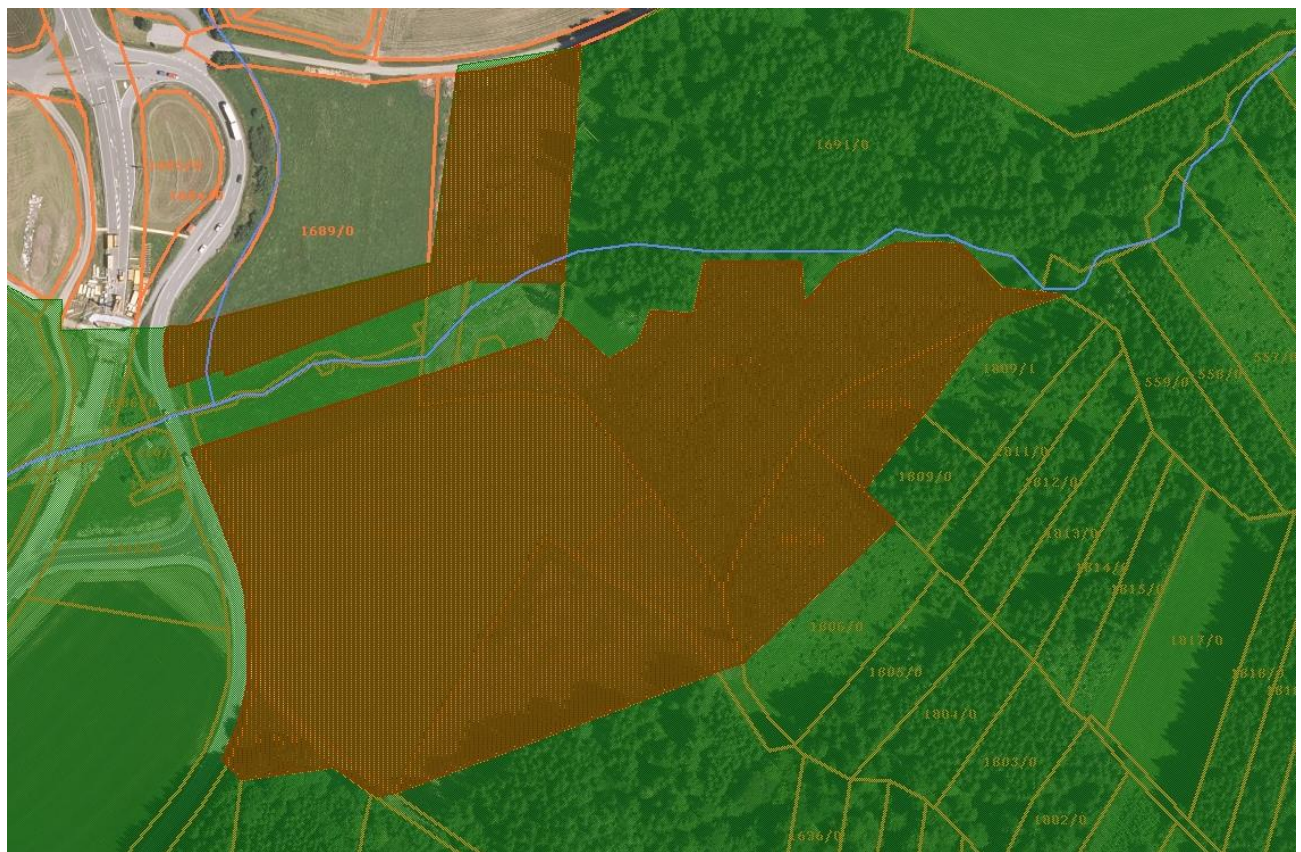
M 1 : 2.500 Grün: LSG (Landschaftsschutzgebiet – Bestand), Rot: Herausnahme Fläche